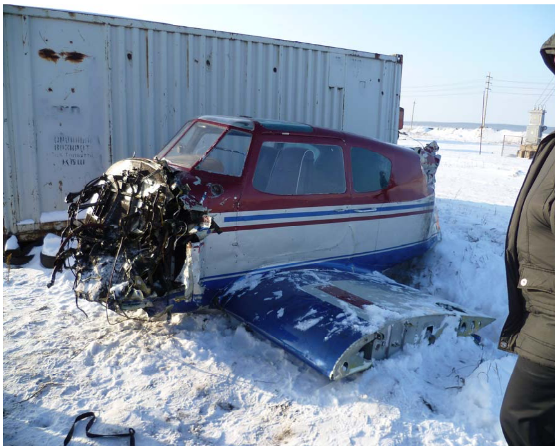
Рис. 1. Состояние планера ВС после АП

В результате воздействия нерасчётных нагрузок при падении самолета на лед водохранилища конструкция планера самолета и его систем подверглась множественным повреждениям: двигатель с моторамой крепления, хвостовая часть самолета, ОЧК левой плоскости отделены от фюзеляжа и практически полностью разрушены (Рис.1). Маслбак и маслорадиатор полностью разрушены, лопасти воздушного винта разрушены по комли (Рис. 2), правая плоскость имеет повреждения.