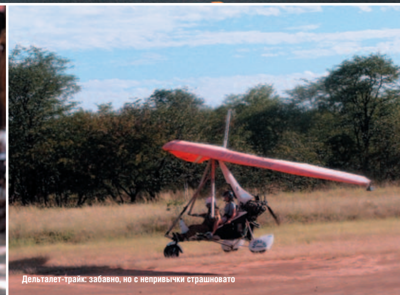
Дельтател-трайк: забавно, но с непривычки страшновато