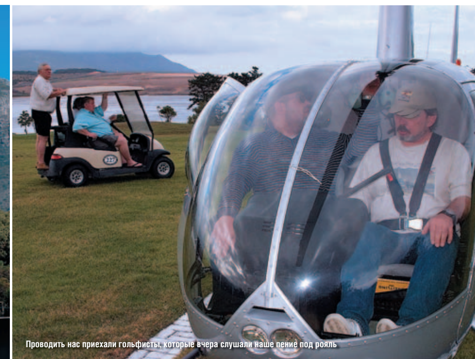
Проводить нас приехали гольфисты, которые вчера слушали наше пение под рояль