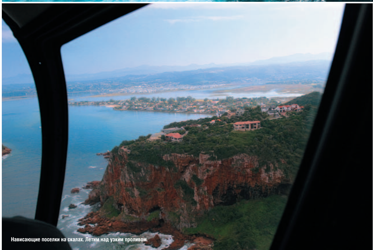
Нависающие поселки на скалах. Летим над узким проливом.