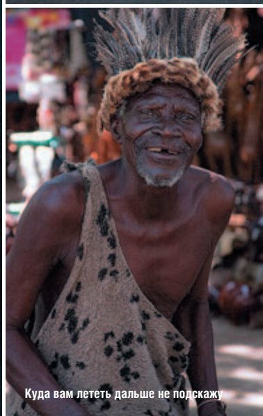
Куда вам лететь дальше не подскажу