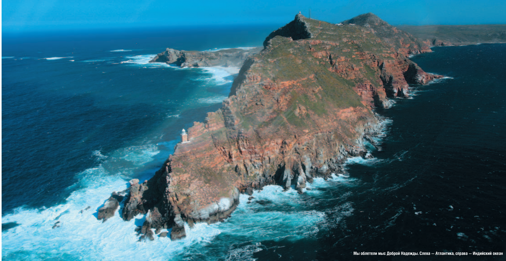
Мы облетели мыс Доброй Надежды. Слева — Атлантика, справа — Индийский океан