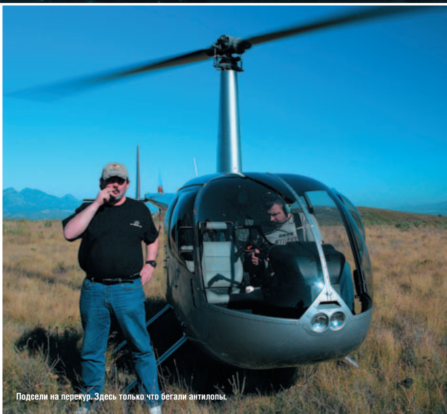
Подсели на перекур. Здесь только что бегали антилопы.

Планирование — вещь полезная и, несомненно, способствующая комфорту. Однако, часто нарушение планов по форс-мажорным причинам добавляет в жизнь немного перчика и позволяет получить больше удовольствия. Так случилось и с нами во время прогулки по Африке.