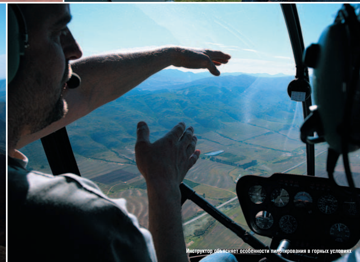
Инструктор объясняет особенности пилотирования в горных условиях